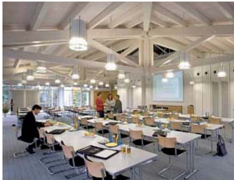
Akademie-Standort Karlsruhe/Seminarraum Karlsruhe