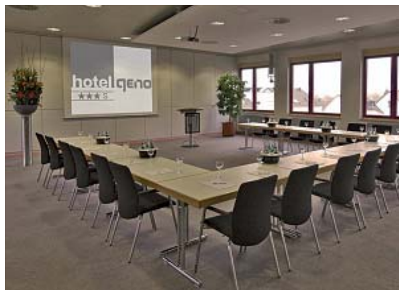
Akademie-Standort Stuttgart/Seminarraum Stuttgart