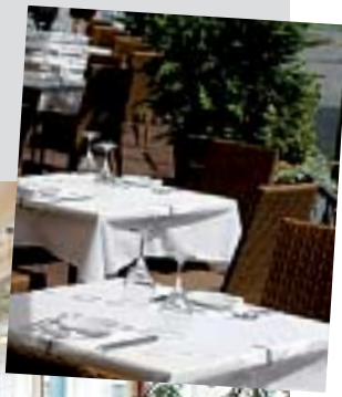
Bistro mit Terrasse Stuttgart